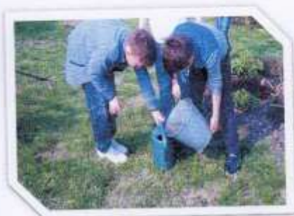
Высадка рассады бархатцев. Уход за высаженными растениями.